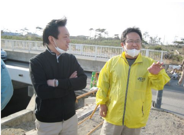
(被災状況の報告を受ける福井会頭)

福井会頭は高野理事長から震災発生から現在に至るまでの経過や、現在の状況について詳細にわたり報告を受け、その後津波の被害が甚大な海岸線や市街地を視察し、できる限りの支援を実施していく事を伝えました。