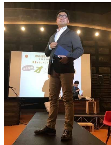
ランウェイのデモ