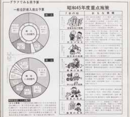
▲昭和45年度の福岡県一般会計歳入歳出予算 『ふくおか 昭和45年度』(福岡県行政資料)