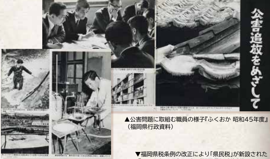
▲公害問題に取り組む職員の様子『ふくおか 昭和45年度』 (福岡県行政資料)