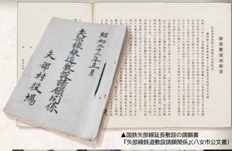
▲国鉄夫部線延長敷設の請願書 『夫部線鉄道敷設諸願関係』(八女市公文書)