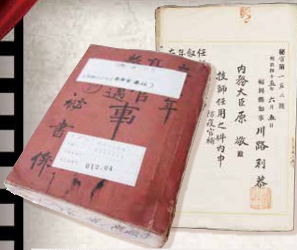
◀職員任用について内務大臣に伺う文書 『正規職員任免高等官、委任』福岡県公文書

今回の特別展では、この「税金」、つまり、行政運営に使われた「お金」に焦点を当て、時代を象徴する施策にどれだけの事業費が、また行政サービスに携わる公務員にどれだけの人件費が投入されたのか、その記録を探ります。