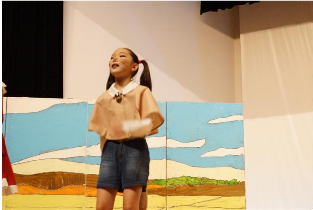
ミュージカル事業参加状況