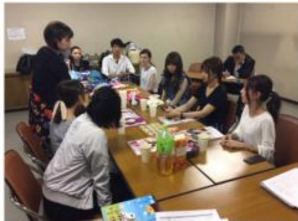
PR strategy meeting with partners