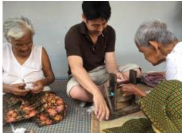
Interviewed with local producers