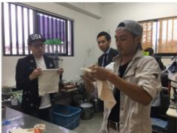
Sample selection of Arimatsu Shibori