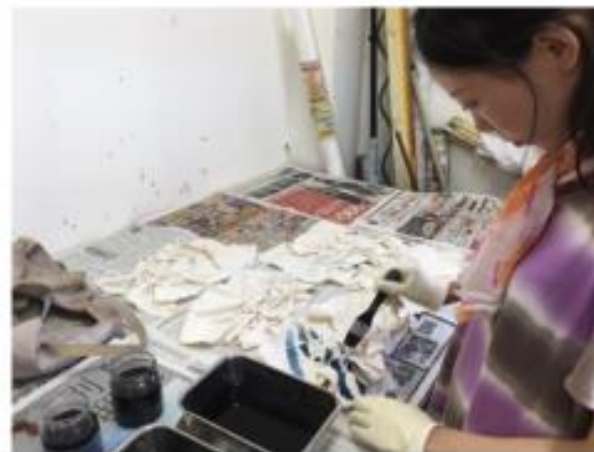
Product design by craftspeople