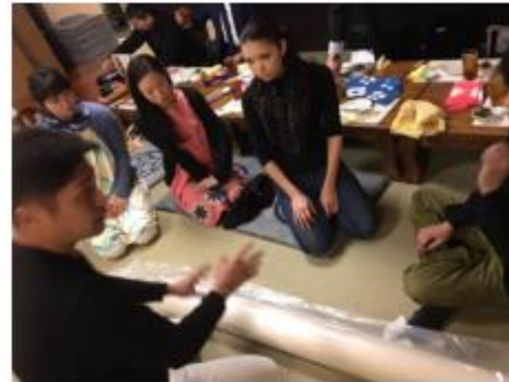
Product development with partners