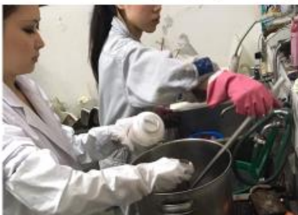
Arimatsu Shibori tie dyeing by craftspeople