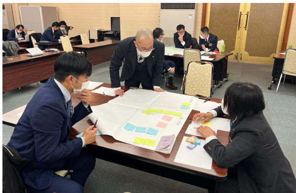
VMV実施様子（群馬ブロック協議会）