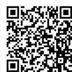
トレーナー通信特設サイト はこちら