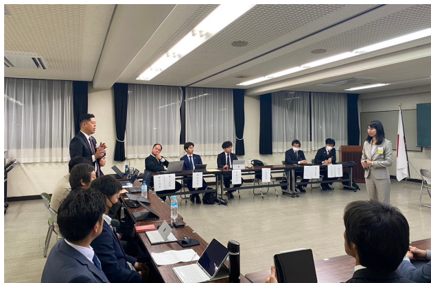
ロバート議事法実施様子 (JCI那賀)