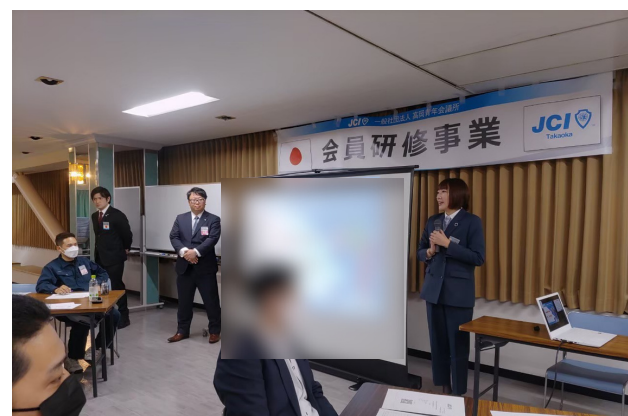
JCゲーム実施様子 (JCI高岡)