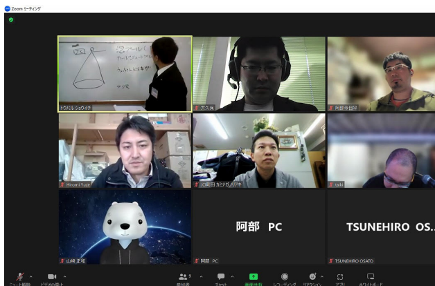
ZoomでのVF実施様子 (JCI鹿角)