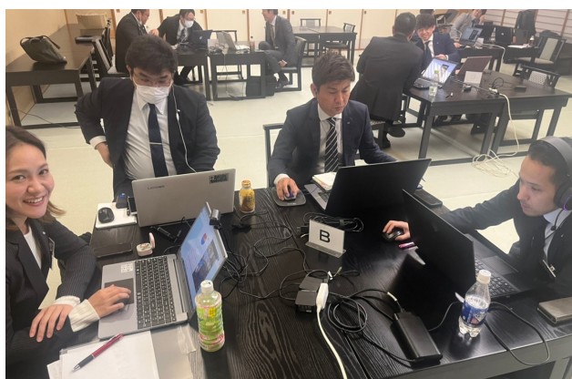
JCI Impact実施様子 (JCI天童)