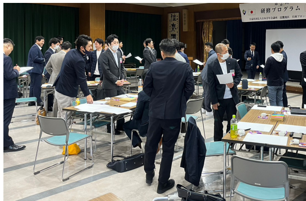
マインドマップ実施様子 (JCI兵庫)