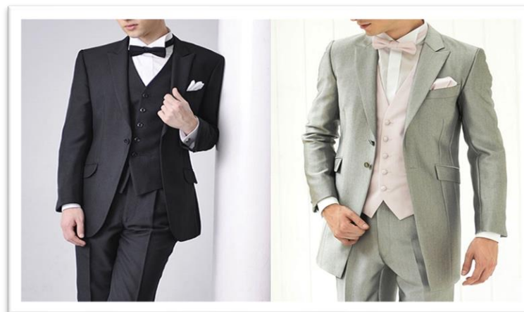
テイルコート（燕尾服） タキシード夜の正礼装