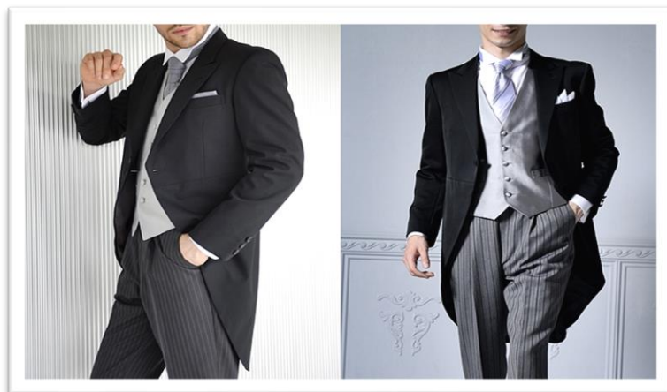
モーニングコート昼の正礼装