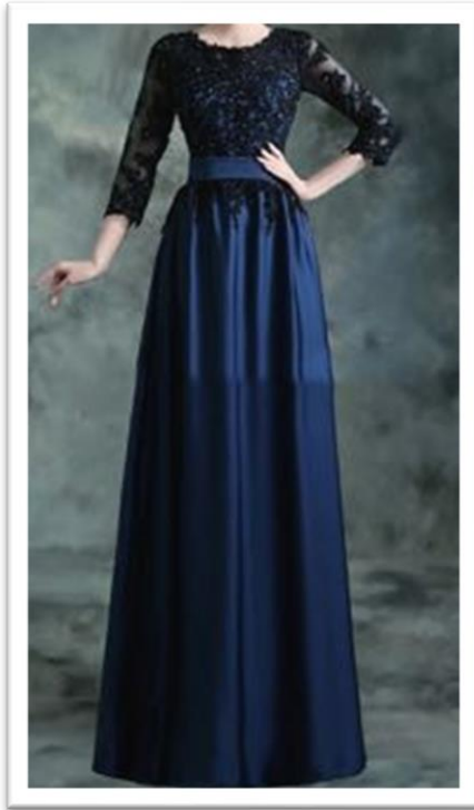
アフタヌーンドレス 昼の正礼装