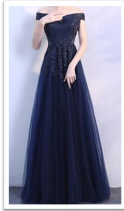
イブニングドレス 夜の正礼装