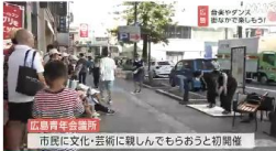
市民に文化・芸術に親しんでもらおうと初開催