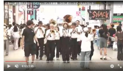
広島中心部で歌や大道芸などパフォーマンスを披露…ひろしまハートビートストリート

歌や大道芸など様々なパフォーマンスを街中で披露する「ひろしまハートビートストリート」が広島市中心部で開かれています。