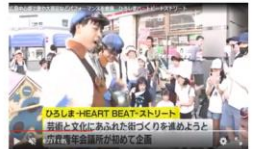
ひろしま・HEART BEAT・ストリート 芸術と文化にあふれた街づくりを推進しよう と市民が参加するイベントが実施