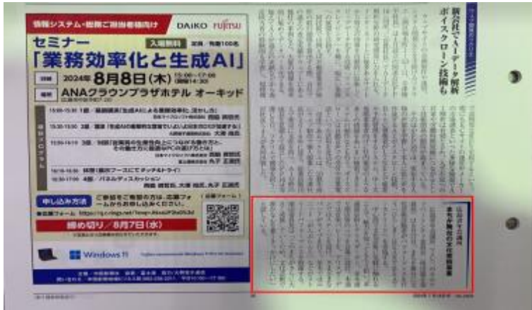
広島経済レポート7月18日号