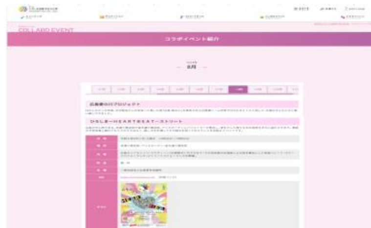
第2回ひろしま国際平和文化祭 コラボイベントとして掲載