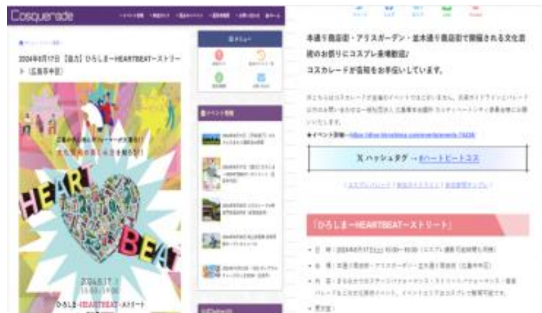
コスカレード実行委員会 HPで事業への協力依頼掲載

広島経済レポートやDive!Hiroshima、各団体のHPに掲載されたことで事業の認知度が高まり、参加者が増えたことによって、事業に参加いただいた事業者様の知名度をあげることができました